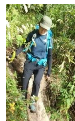
荷を背負って歩く