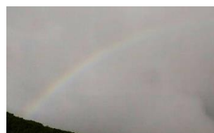
蝶ヶ岳 稜線から見た虹