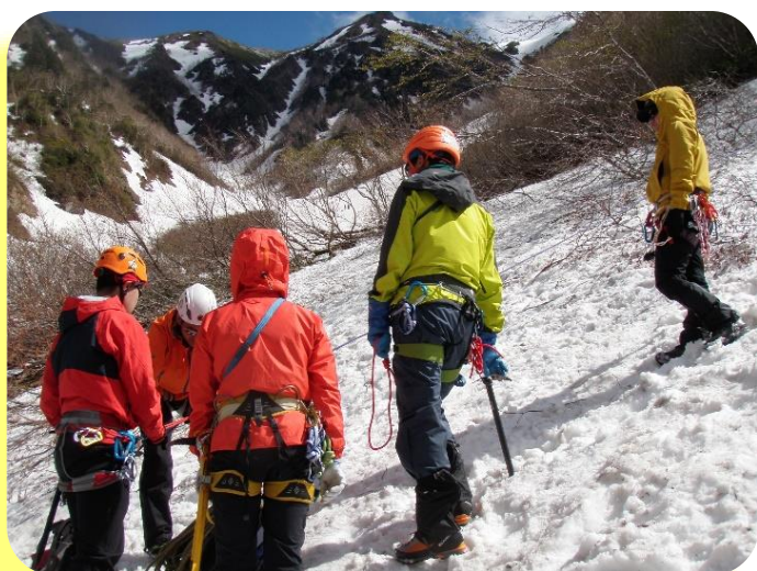
確実な雪上技術を身に着ける (5月)