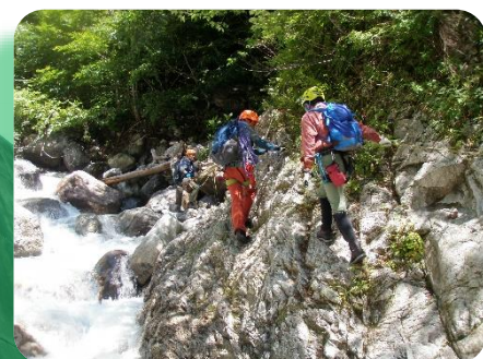
危険個所の通過技術を学ぶ (7月)