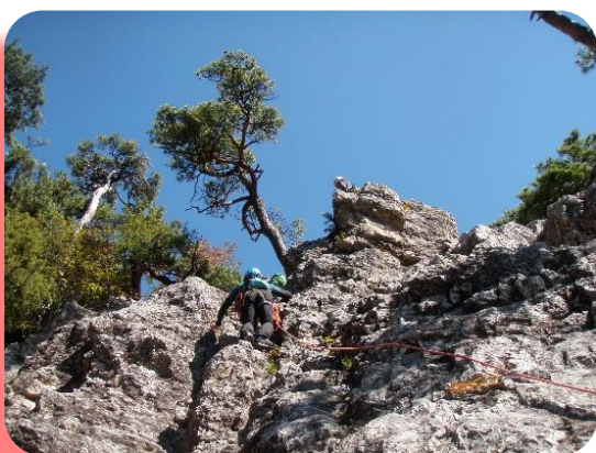
総合的なロープワークを実践 (10月)